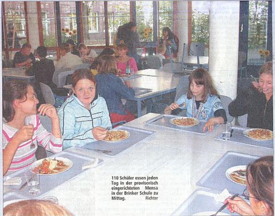
110 Schüler essen jeden Tag in der provisorisch eingerichteten Mensa in der Brinker Schule zu Mittag. Richter

Einige Schüler der zehnten Klassen leiten mit dem Lehrgang zum Jugendgruppenleiter (JuLeiCa) mehrere AGs. In Eigenregie müssen sie die Kurse planen und organisieren. „Die Mädchen und Jungen lernen den Schulalltag aus der Sicht eines Lehrers kennen. Die praktische Erfahrung als Leiter macht sich sicher auch gut im Lebenslauf“, meint John.